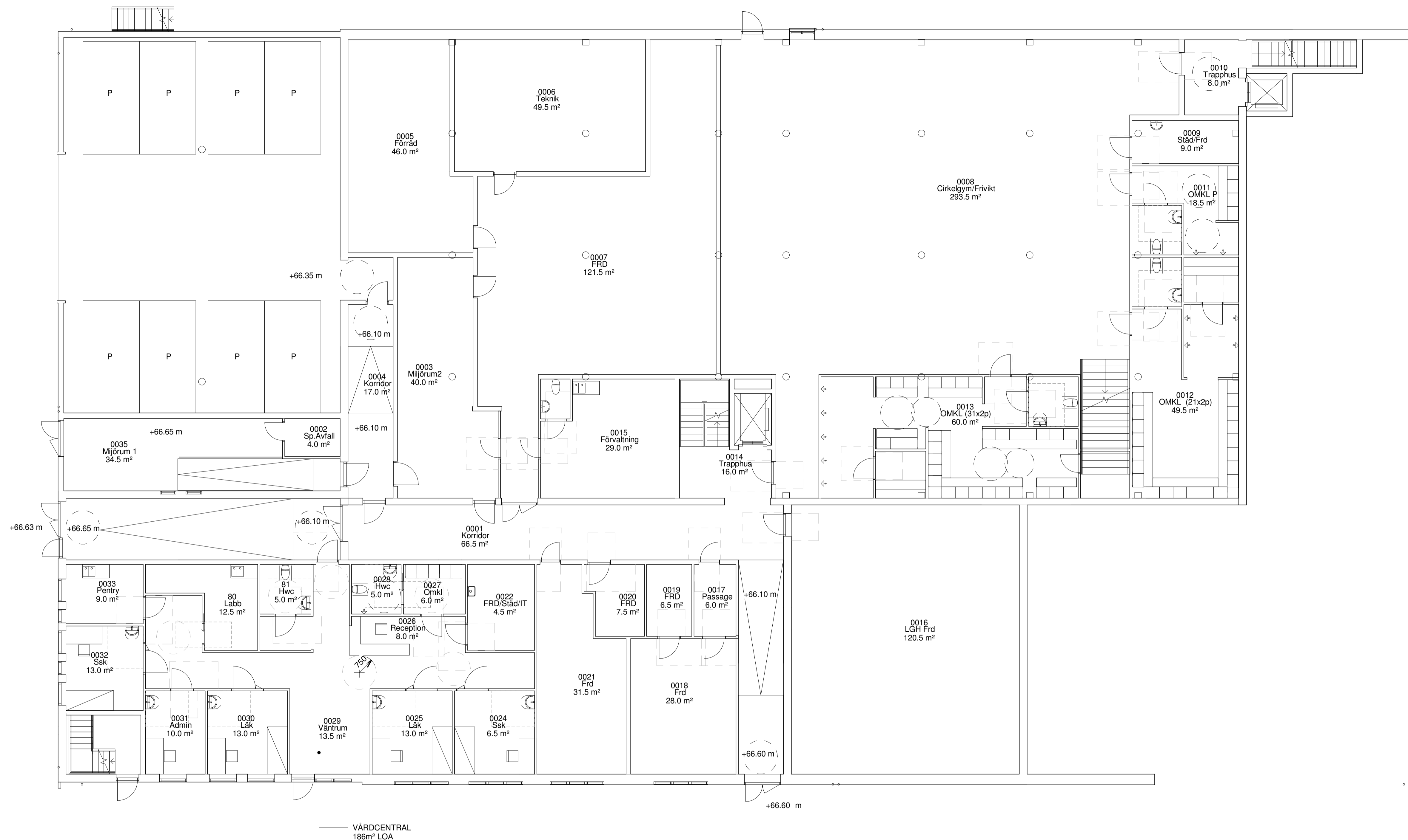
PLAN 0 1:100

Glas, plast, papp och övriga sorteringskärl sorteras av boende i Miljörum 2. Fastighetsskötare ställer ut kärl för tömning i Miljörum 1